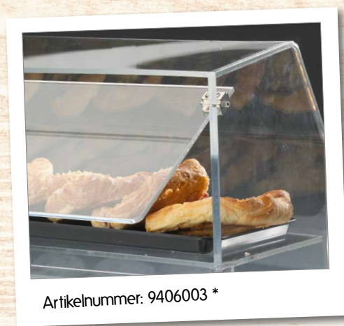
Artikelnummer: 9406003 *

* Klappe als Zubehör zusätzlich bestellbar.