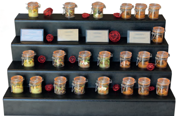
Thekentreppe Premium schwarz, 4 Stufen, Bestell-Nr. 726, Breite 680 mm / Tiefe 400 mm / Höhe 320 mm