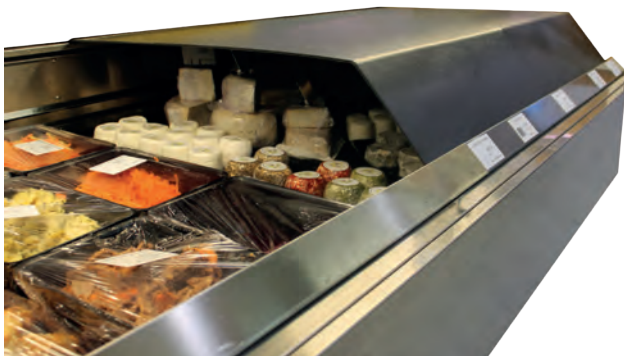
Nachtabdeckung für Metzgerei-, Käse-, Feinkosttheken, verschiedene Größen, lt. Kundenskizze (innerhalb der Abmessung von 1060 x 680 mm möglich)