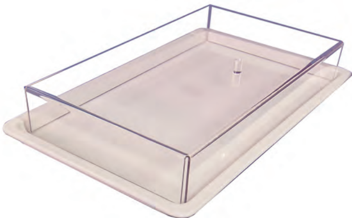
Abdeckhaube ohne Tablett, Bestell-Nr. 733, Breite 465 mm / Tiefe 270 mm / Höhe 70 mm