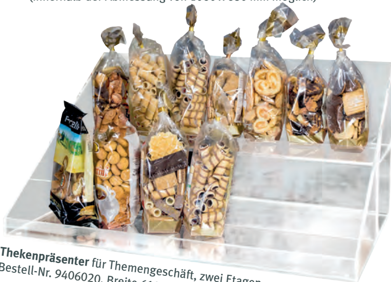
Thekenpräsentier für Themengeschäft, zwei Etagen, Bestell-Nr. 9406020, Breite 610 mm / Tiefe 400 mm / Höhe 300 mm